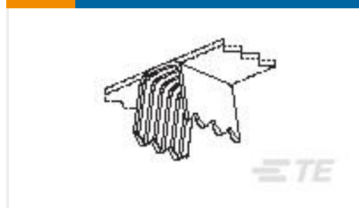
TE 产品编号1601511-1 G061C16B=RTM 900-2600