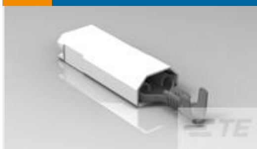
TE 产品编号520988-1 ULTRA-POD 250 ASSY REC 22-18 AWG BR