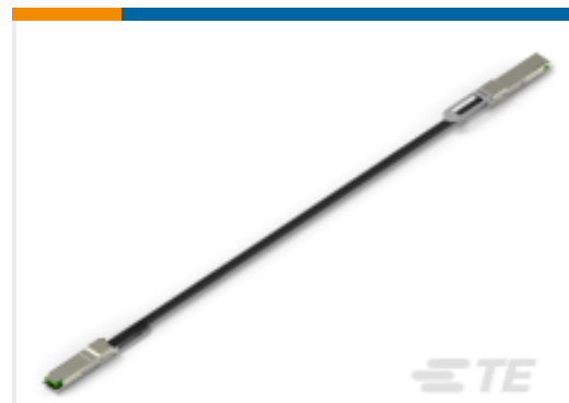
TE 产品编号2333393-7 QSFP 25GIG 30AWG 3 METER