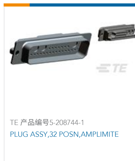
TE 产品编号5-208744-1 PLUG ASSY,32 POSN,AMPLIMITE