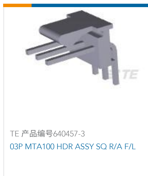
TE 产品编号640457-3 03P MTA100 HDR ASSY SQ R/A F/L