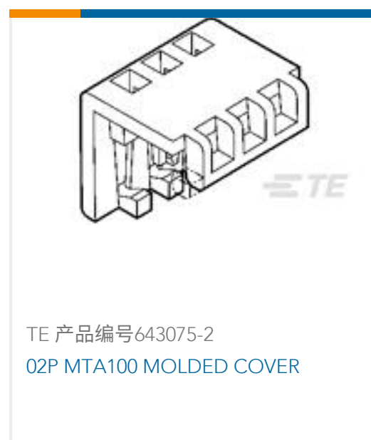
TE 产品编号643075-2 02P MTA100 MOLDED COVER