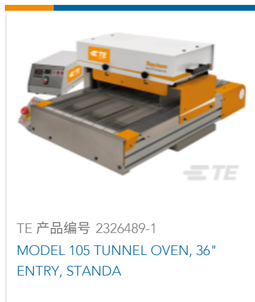
TE 产品编号 2326489-1 MODEL 105 TUNNEL OVEN, 36" ENTRY, STAND