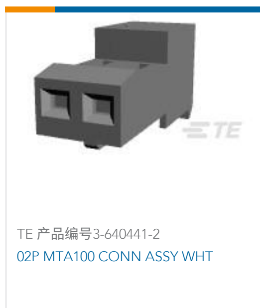
TE 产品编号3-640441-2 02P MTA100 CONN ASSY WHT