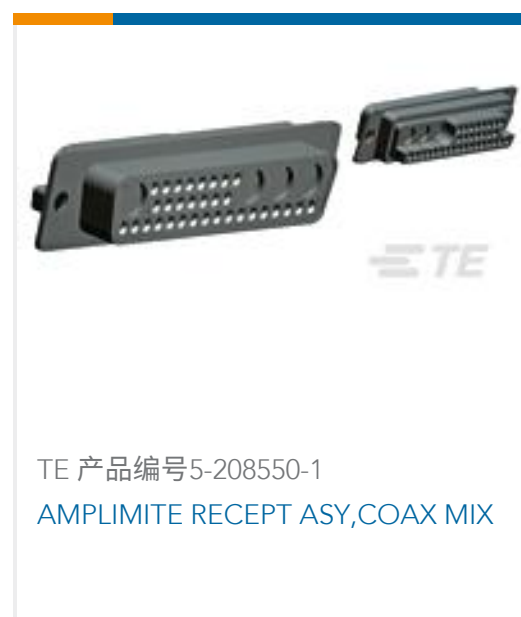
TE 产品编号5-208550-1 AMPLIMITE RECEPT ASY,COAX MIX