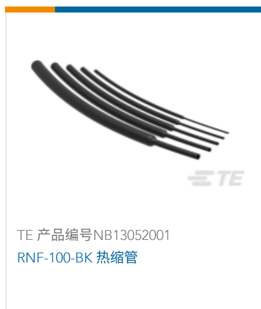
TE 产品编号NB13052001 RNF-100-BK 热缩管