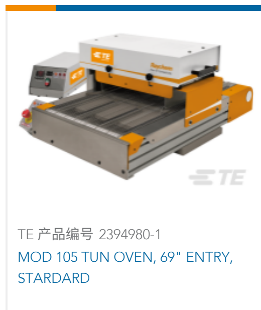
TE 产品编号 2394980-1 MOD 105 TUN OVEN, 69" ENTRY, STANDARD