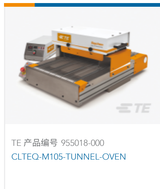
TE 产品编号 955018-000 CLTEQ-M105-TUNNEL-OVEN