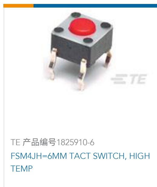
TE 产品编号1825910-6 FSM4JH=6MM TACT SWITCH, HIGH TEMP