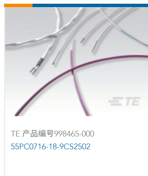
TE 产品编号998465-000 55PC0716-18-9CS2502