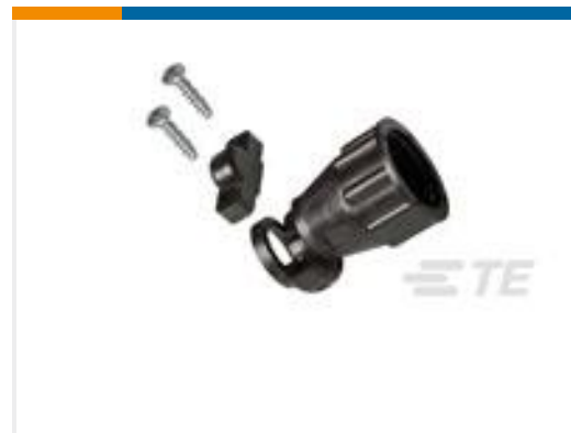
TE 产品编号1-206062-6 CABLE CLAMP KIT #11