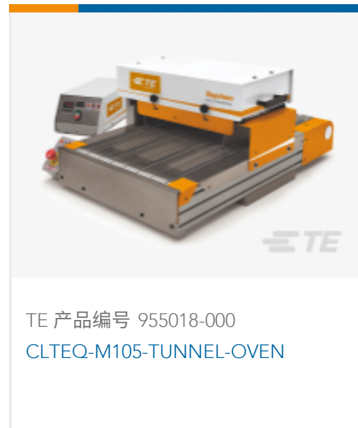
TE 产品编号 955018-000 CLTEQ-M105-TUNNEL-OVEN