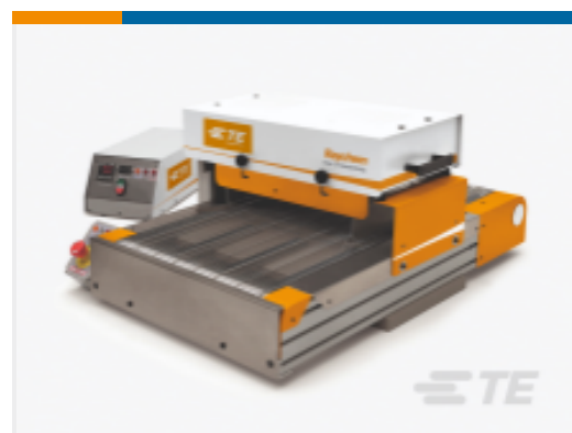
TE 产品编号 955018-000 CLTEQ-M105-TUNNEL-OVEN