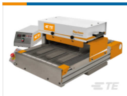
TE 产品编号 2326489-1 MODEL 105 TUNNEL OVEN, 36" ENTRY, STAND A