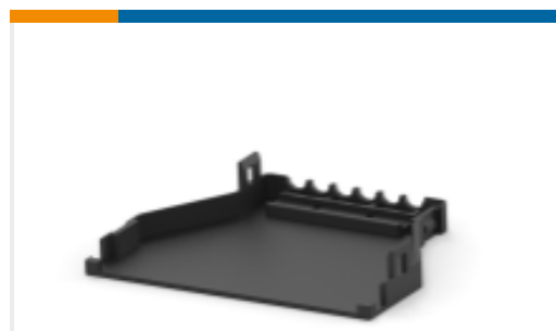
TE 产品编号1776695-1 Strain Relief, D5200, Dynamic