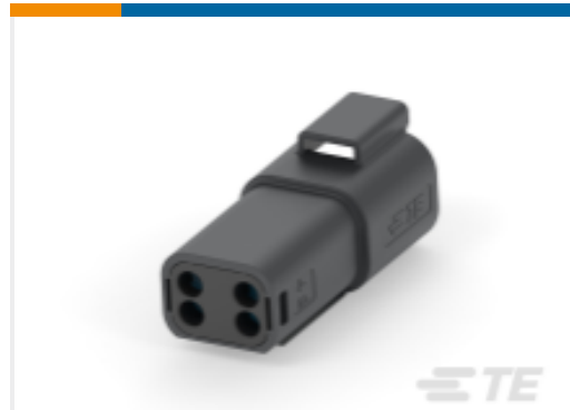
TE 产品编号1-2600030-0 4CCT BLACK RECEPT W/LARGE SEAL