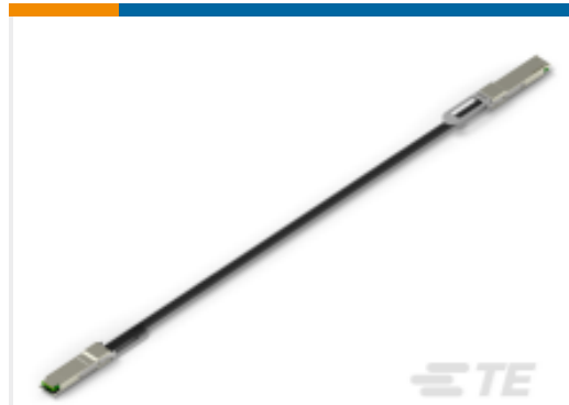
TE 产品编号2333393-7 QSFP 25GIG 30AWG 3 METER