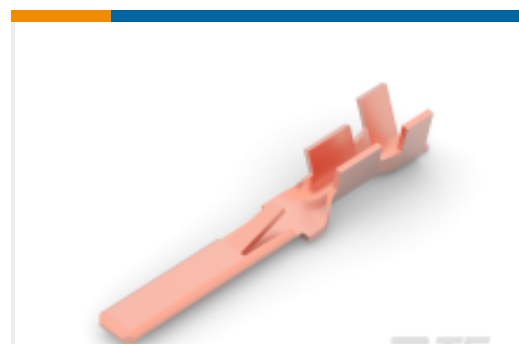
TE 产品编号881719-4 .110 S FASTIN-ON TA