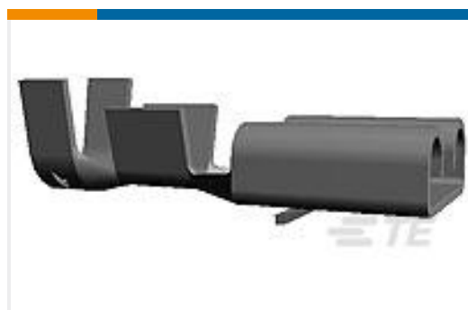
TE 产品编号160811-8 FF 250 REC 4-6MM2 PB