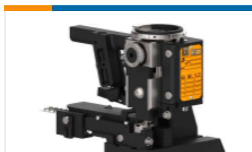
TE 产品编号2-2151581-1 OCEAN-2.0-APPLICATOR-S-070F090OV