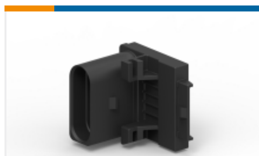
TE 产品编号3-2137656-1 HAIMA CMC ASSY