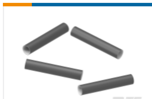
TE 产品编号CL8309-000 FL2500 热缩管