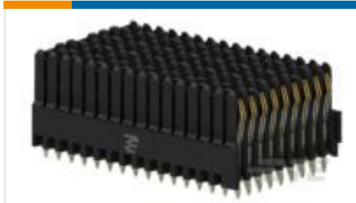
TE 产品编号1410140-2 MULTIGIG RT T2 .8" BP FULL CNT