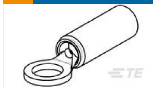
TE 产品编号1577625-1 TERMINAL RT PIDG PEEK STRATO 20 AWG