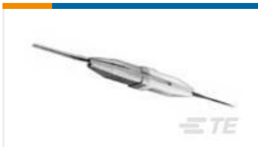
TE 产品编号91067-2 INSERTION/EXTRACTION TOOL