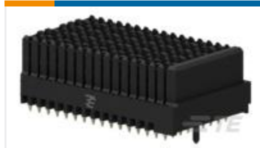
TE 产品编号1410142-2 MULTIGIG RT T2 .8" BP FULL RGH