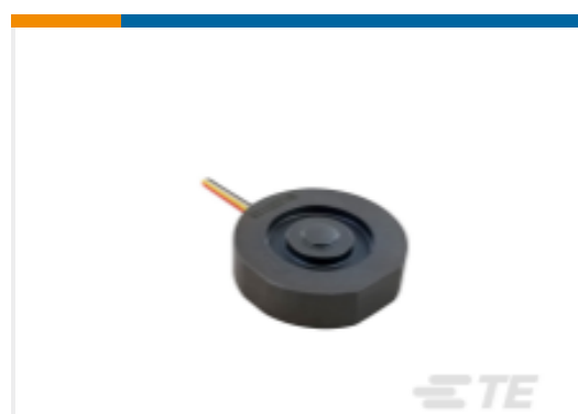
TE 产品编号20009605-20 FX29K0-100A-0010-L