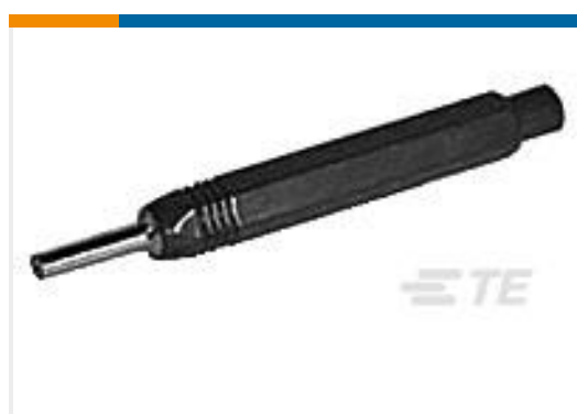
TE 产品编号1102855-2 AWZG-HN.D-RSZ