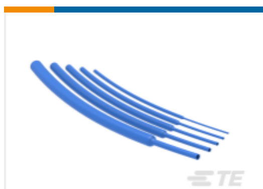
TE 产品编号5053222025 RNF-100-6 热缩管