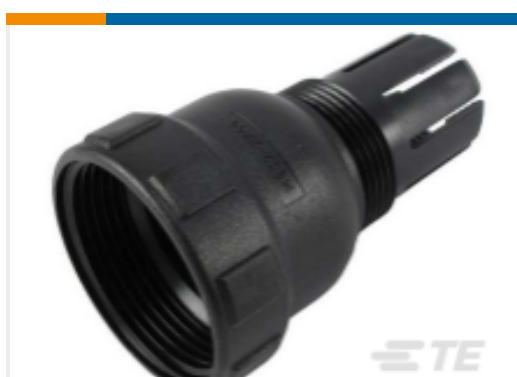
TE 产品编号M902-2244 BKSHL, 24SZ, CBL SZ .570-.710, HDP L015