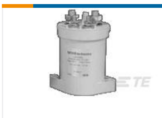
TE 产品编号8-1618388-3 LEV200AKANA=RELAY, SPST-NO