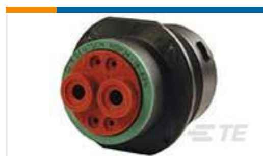
TE 产品编号HDP24-18-6PN REC, 6P, BLK, N, 4/16, P