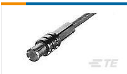
TE 产品编号1060875-2 MCX CABLE PLUG, CRIMP ATTACH