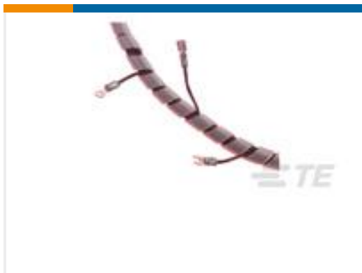
TE 产品编号500024-1 SPIRAP 1/4" PTFE, NAT, 50 FT