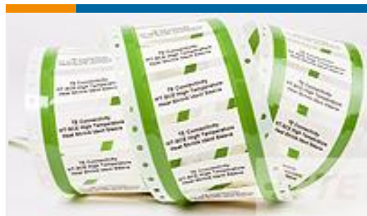
TE 产品编号8716810001 HT-SCE-3/8-2.0-9