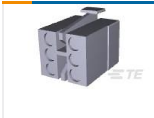
TE 产品编号1-480270-0 06P CMNL PLUG HSG M/M NATL