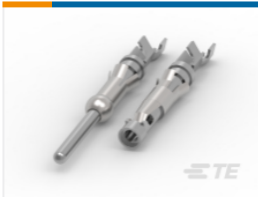
TE 产品编号1-66105-9 Pin and Socket Contacts, Type III, LP