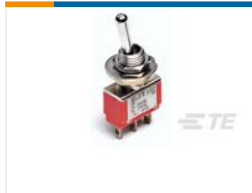
TE 产品编号4-1825136-9 A101SYZQ04