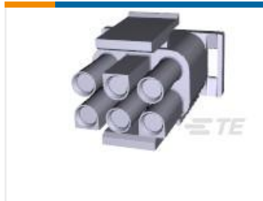
TE 产品编号1-1644055-2 UMNL 6 WAY PLUG HOUSING