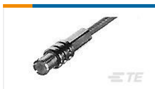
TE 产品编号1060875-2 MCX CABLE PLUG, CRIMP ATTACH