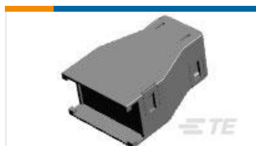
TE 产品编号1986185-1 Strain Relief,6 Posn,D5200 Dynamic. 2