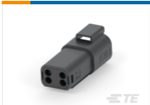
TE 产品编号1-2600030-0 4CCT BLACK RECEPT W/LARGE SEAL