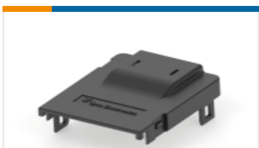
TE 产品编号1986186-1 Strain Relief,20 Posn,D3000 Dynamic, 2