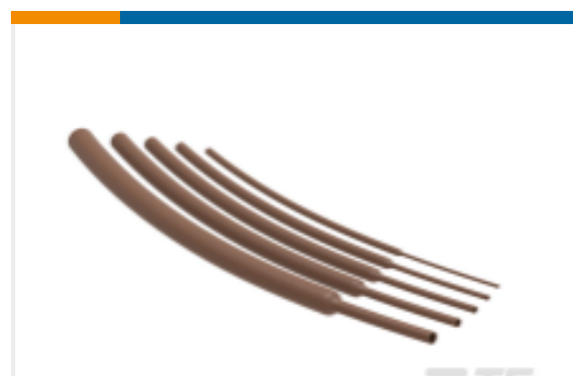
TE 产品编号5053004011 RNF-100-1 热缩管