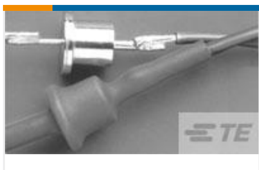
TE 产品编号5677574004 RNF-3000-6/2-0-SP