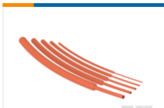
TE 产品编号5053064027 RNF-100-3 热缩管