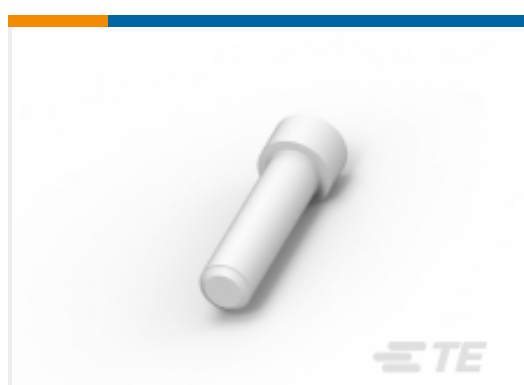
TE 产品编号114017-ZZ SEALING PLUG, SIZE 12/16, WHT