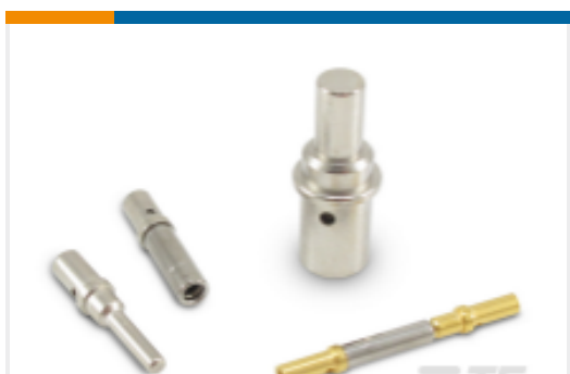
TE 产品编号0460-202-16141 DEUTSCH Solid Contacts