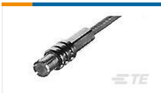
TE 产品编号1060875-2 MCX CABLE PLUG, CRIMP ATTACH