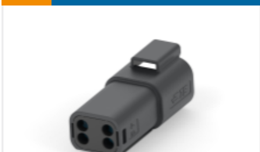
TE 产品编号1-2600030-0 4CCT BLACK RECEP W/LARGE SEAL