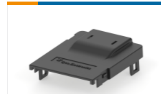
TE 产品编号1986186-1 Strain Relief,20 Posn,D3000 Dynamic, 2