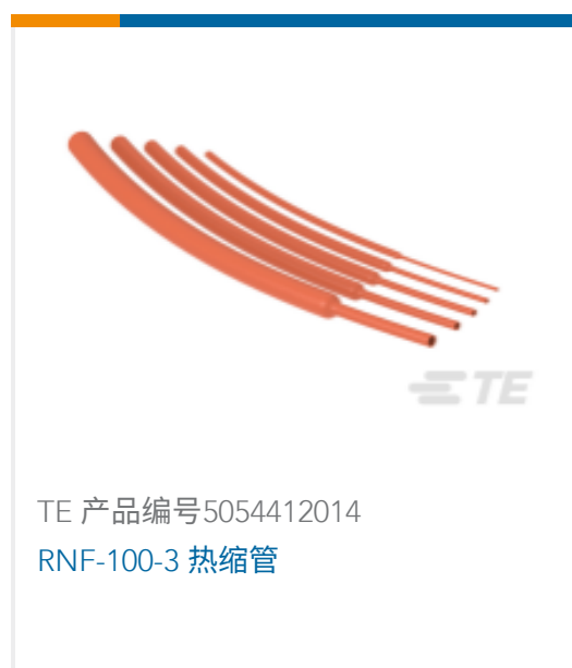
TE 产品编号5054412014 RNF-100-3 热缩管