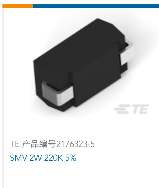
TE 产品编号2176323-5 SMV 2W 220K 5%