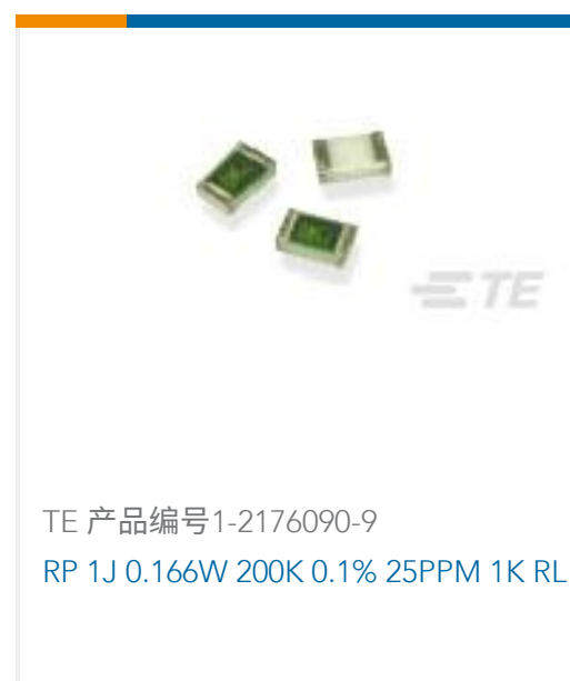
TE 产品编号1-2176090-9 RP 1J 0.166W 200K 0.1% 25PPM 1K RL