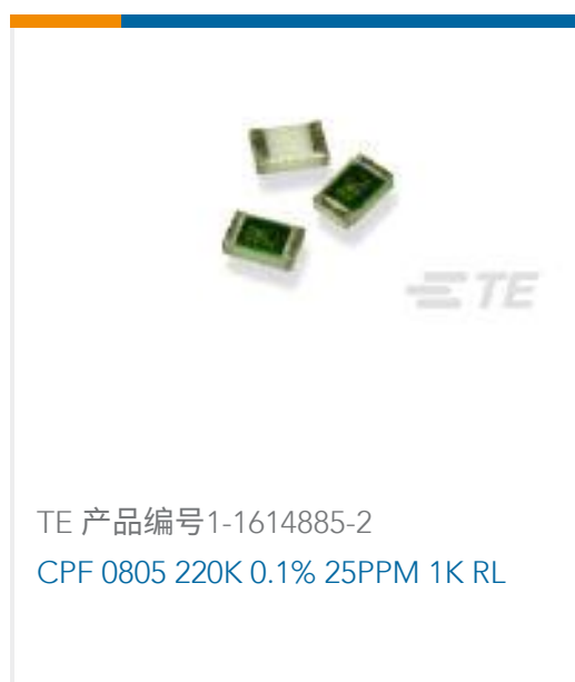
TE 产品编号1-1614885-2 CPF 0805 220K 0.1% 25PPM 1K RL