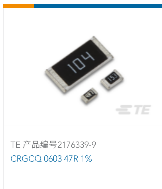
TE 产品编号2176339-9 CRGCO 0603 47R 1%