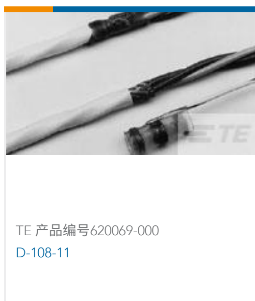
TE 产品编号620069-000 D-108-11