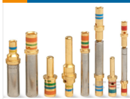
TE 产品编号0641-1-2031L CONT PIN