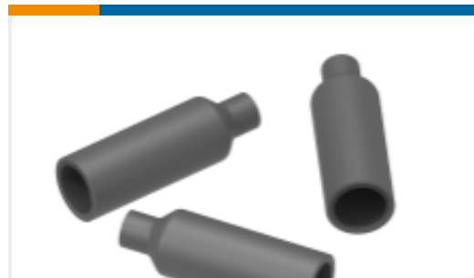
TE 产品编号5510310022 PD-CAP-3/16-0-CS-34034