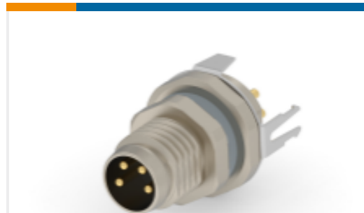
TE 产品编号T4040034041-000 M8.MLE.PNLREAR.4POS.STR PCBSHLD