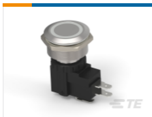
TE 产品编号2364698-1 AVH25 FLT SS MT NO LED 16A