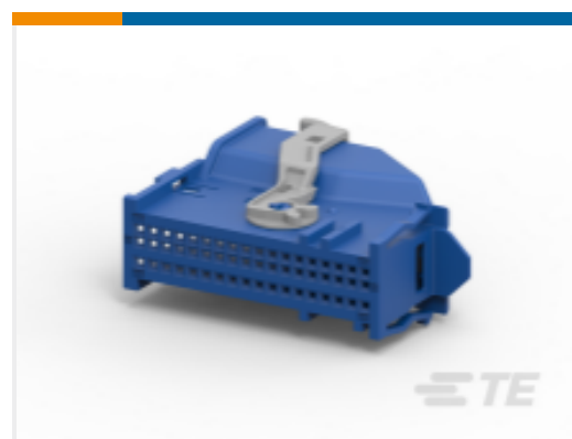
TE 产品编号1924337-3 SHIELD ASSEMBLY, 54 POSN, 0.64 MM KEY C-D