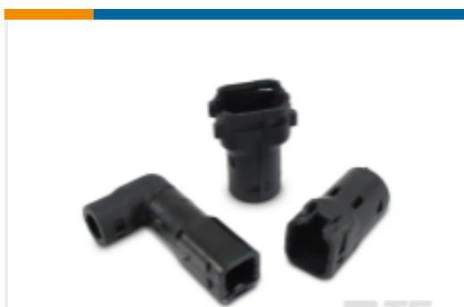
TE 产品编号1028-015-1205 Backshells, DEUTSCH DTM