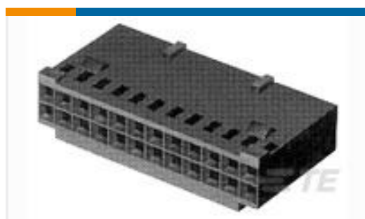
TE 产品编号87631-2 06 MODIV HSG DR MRKD .100 POL