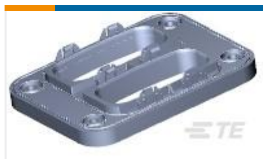
TE 产品编号1813123-1 ASSY FOR SUPPORT PLATE AND SEALING