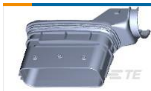
TE 产品编号2-1718324-1 1.5/2.8MM TAB HSG.,62POS.,SEALED