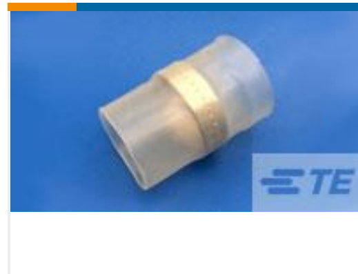
TE 产品编号696437-000 B-051-00-01