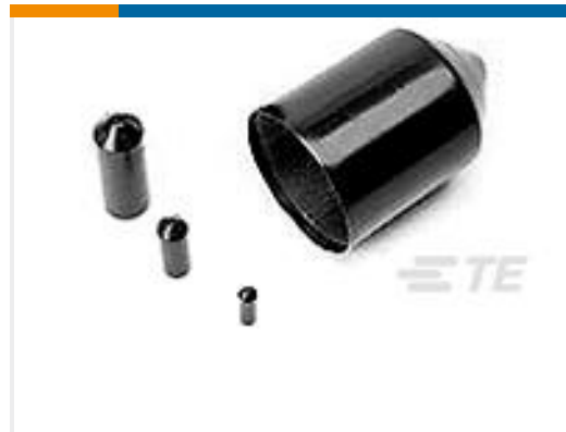
TE 产品编号919641-000 101A052-100-0