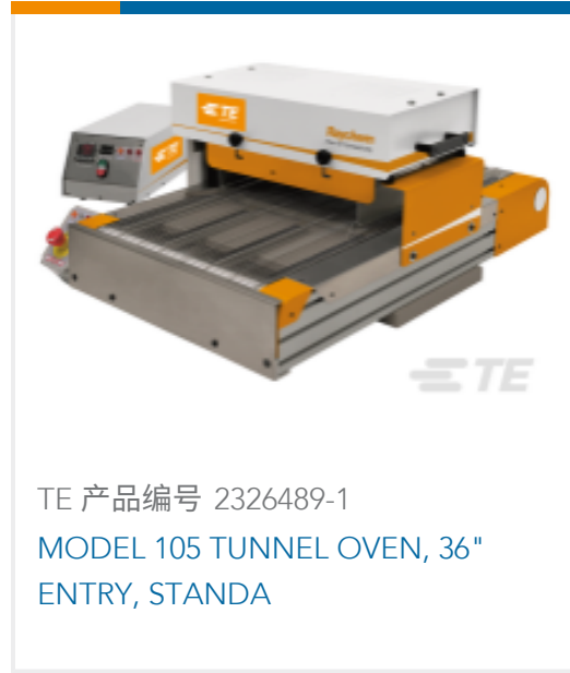
TE 产品编号 2326489-1 MODEL 105 TUNNEL OVEN, 36" ENTRY, STANDA