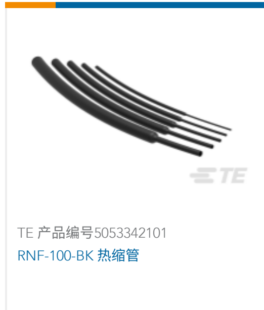
TE 产品编号5053342101 RNF-100-BK 热缩管