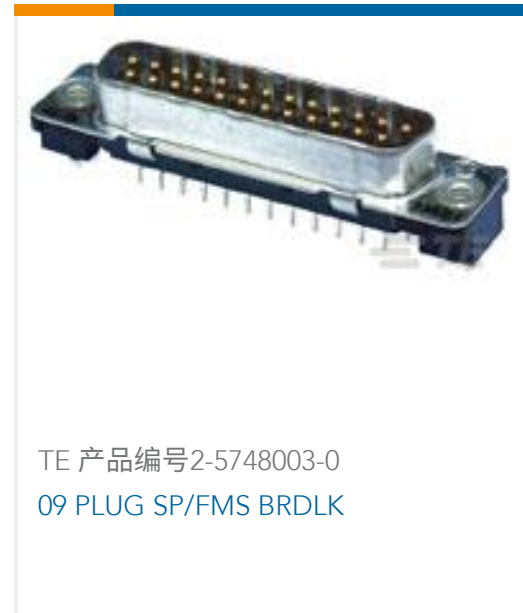
TE 产品编号2-5748003-0 09 PLUG SP/FMS BRDLK