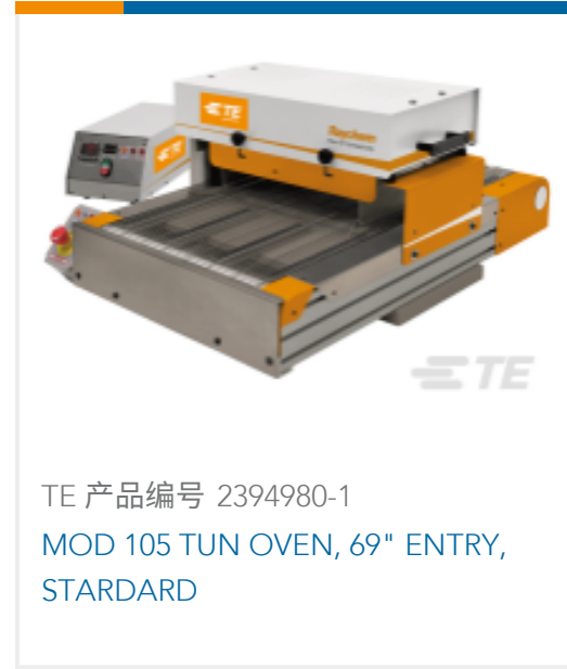
TE 产品编号 2394980-1 MOD 105 TUN OVEN, 69" ENTRY, STANDARD