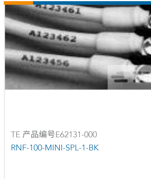
TE 产品编号E62131-000 RNF-100-MINI-SPL-1-BK