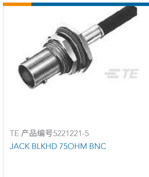
TE 产品编号5221221-5 JACK BLKHD 75OHM BNC