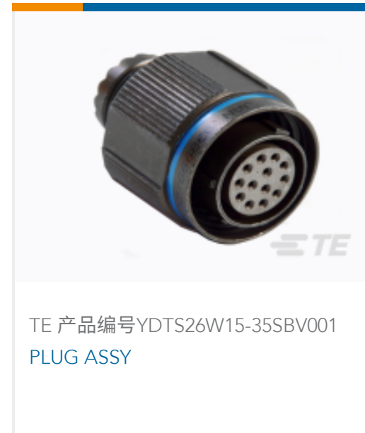
TE 产品编号YDTS26W15-35SBV001 PLUG ASSY