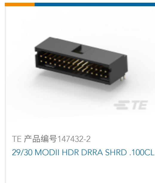
TE 产品编号147432-2 29/30 MODII HDR DRRA SHRD .100CL