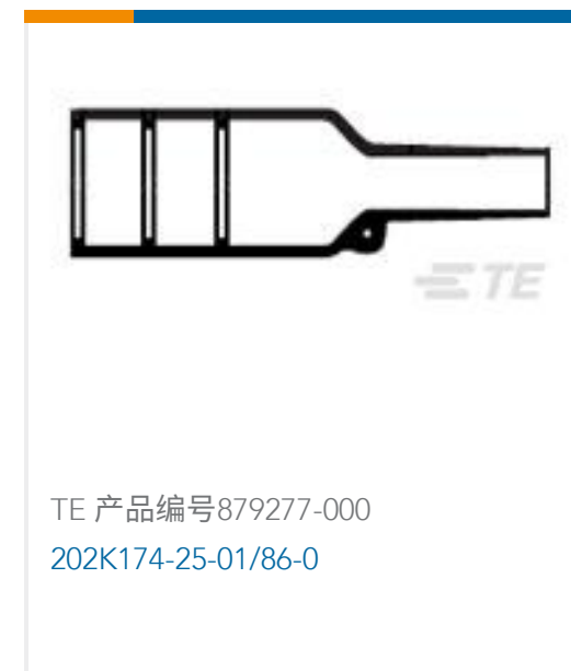
TE 产品编号879277-000 202K174-25-01/86-0