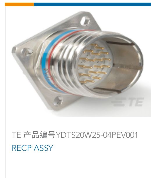
TE 产品编号YDTS20W25-04PEV001 RECP ASSY