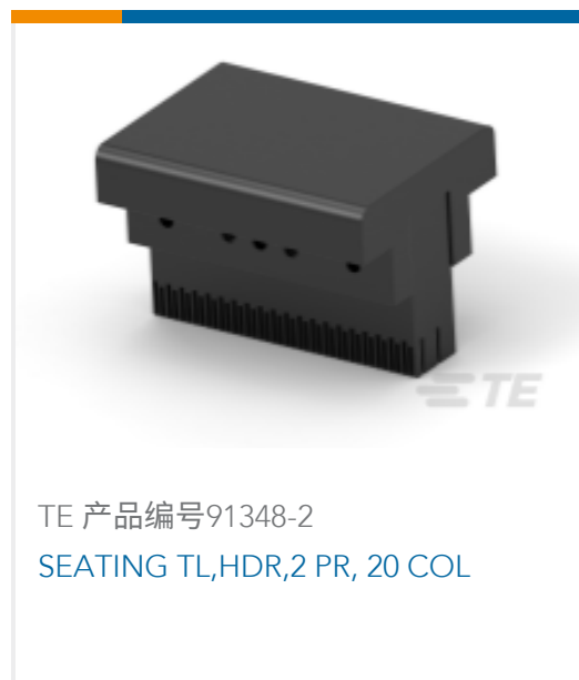
TE 产品编号91348-2 SEATING TL,HDR,2 PR, 20 COL