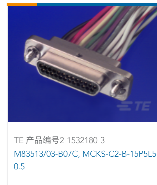
TE 产品编号2-1532180-3 M83513/03-B07C, MCKS-C2-B-15P5L5- 0.5