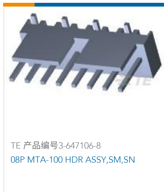
TE 产品编号3-647106-8 08P MTA-100 HDR ASSY,SM,SN