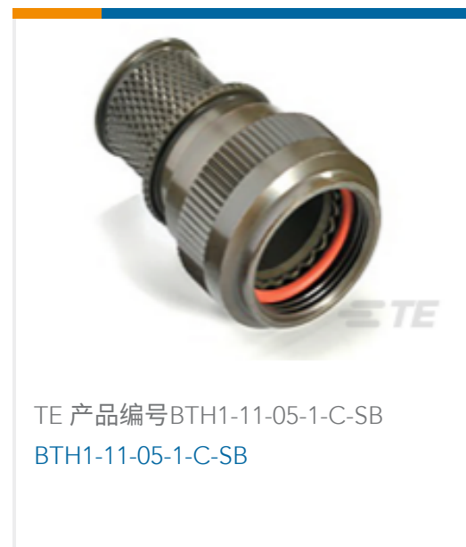
TE 产品编号BTH1-11-05-1-C-SB BTH1-11-05-1-C-SB