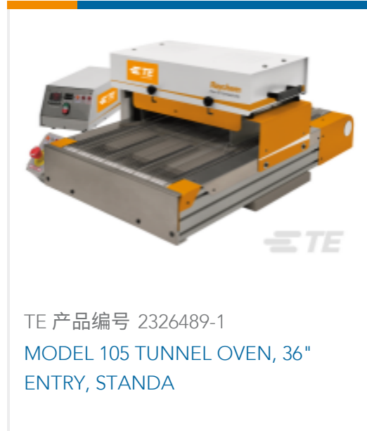
TE 产品编号 2326489-1 MODEL 105 TUNNEL OVEN, 36" ENTRY, STAND