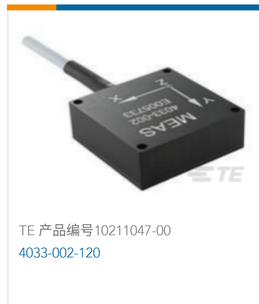
TE 产品编号10211047-00 4033-002-120