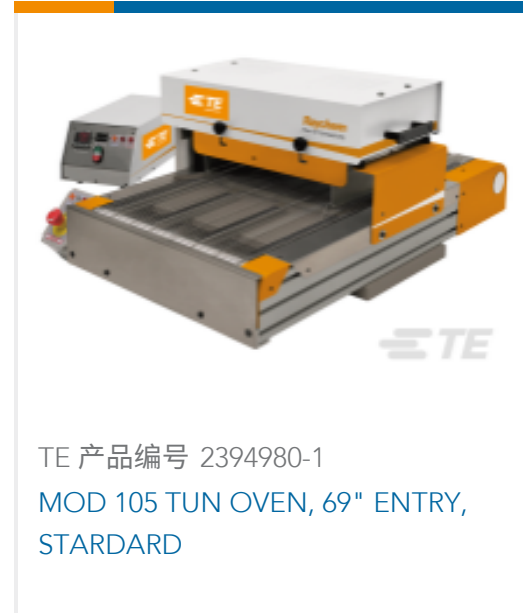
TE 产品编号 2394980-1 MOD 105 TUN OVEN, 69" ENTRY, STANDARD