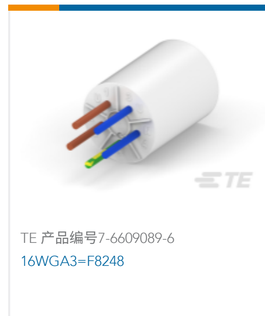
TE 产品编号7-6609089-6 16WGA3=F8248