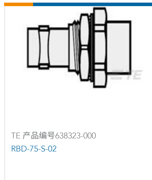
TE 产品编号638323-000 RBD-75-S-02