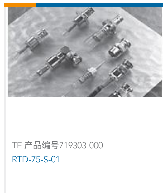
TE 产品编号719303-000 RTD-75-S-01