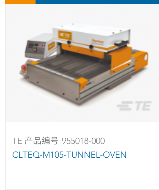
TE 产品编号 955018-000 CLTEQ-M105-TUNNEL-OVEN