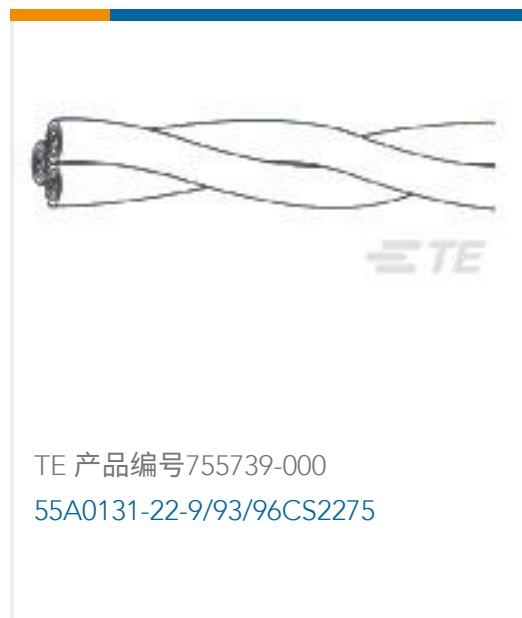
TE 产品编号755739-000 55A0131-22-9/93/96CS2275