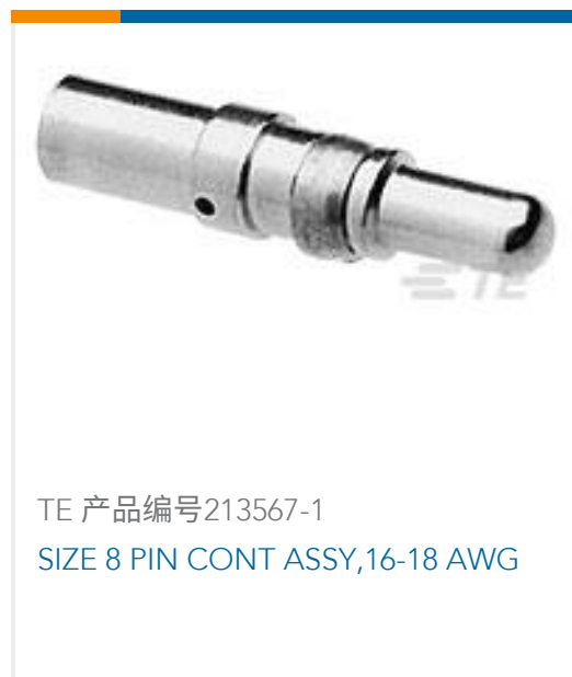
TE 产品编号213567-1 SIZE 8 PIN CONT ASSY,16-18 AWG