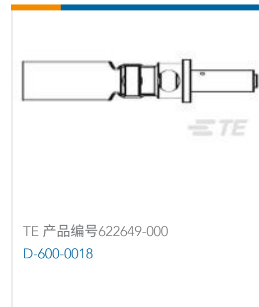
TE 产品编号622649-000 D-600-0018