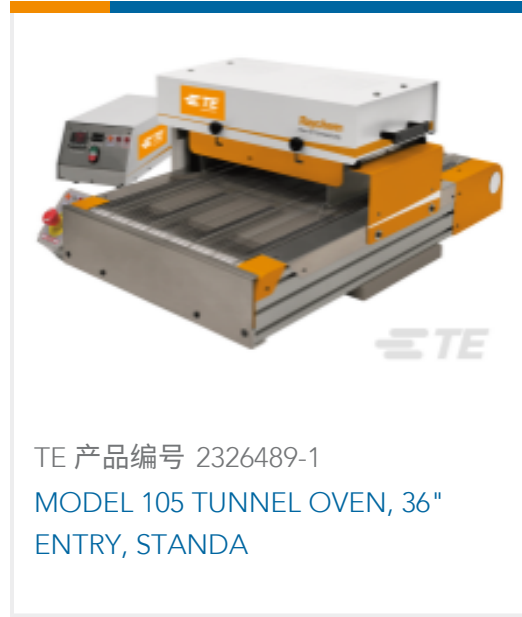
TE 产品编号 2326489-1 MODEL 105 TUNNEL OVEN, 36" ENTRY, STAND