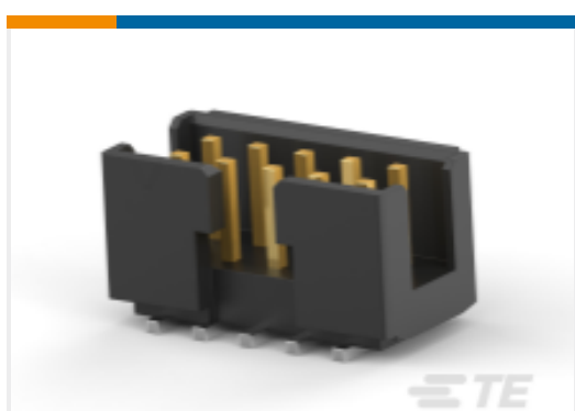
TE 产品编号1-2373376-0 10P,2MM,SHRD HDR,DRVT,SMD,0.1 AU,TB