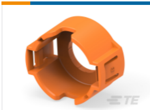
TE 产品编号2-2443908-1 PROP,IPT-HD-1P-COVER-120MM2-CODE-B