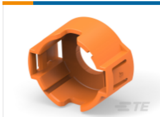
TE 产品编号1-2443906-3 PROP,IPT-HD-1P-COVER-95MM2-CODE-A