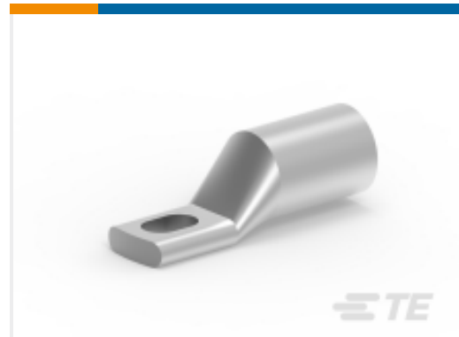
TE 产品编号1670815-3 RING TONGUE, IPT 70 - 120MM?