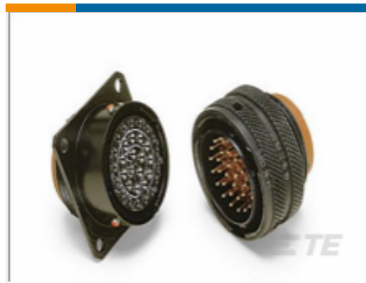
TE 产品编号ZPF000000000005391 910-6F 12-10 SN 01