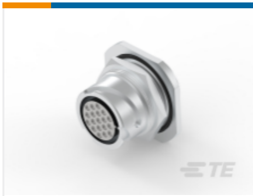
TE 产品编号ZPF000000000119818 EMBASE F RONDE 19PTS T.22 CLAV. N SS RAC