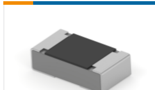
TE 产品编号5-2176475-5 RA73F 1J 21K5 0.1% 1K RL