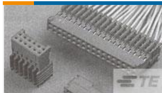
TE 产品编号281792-5 PLUG HE14 IDC 180 2X5 P AWG 28-26