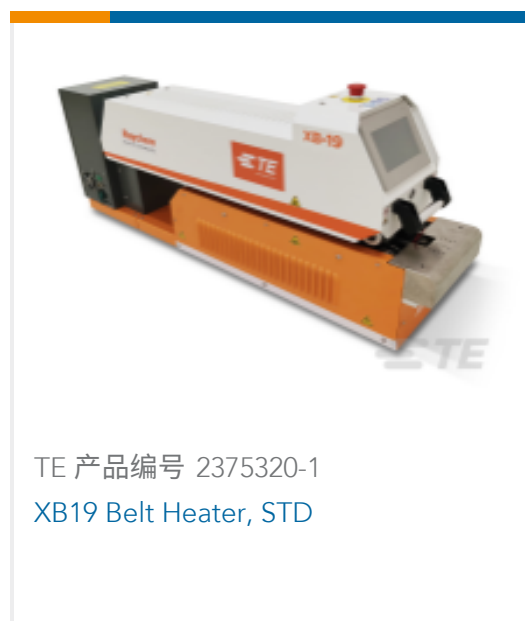
TE 产品编号 2375320-1 XB19 Belt Heater, STD