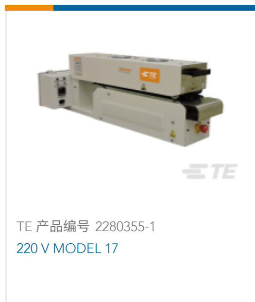
TE 产品编号 2280355-1 220 V MODEL 17