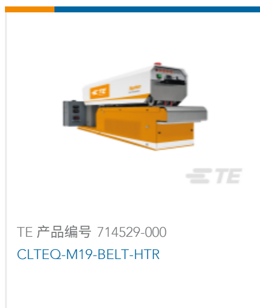
TE 产品编号 714529-000 CLTEQ-M19-BELT-HTR