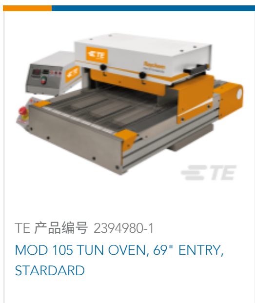
TE 产品编号 2394980-1 MOD 105 TUN OVEN, 69" ENTRY, STANDARD