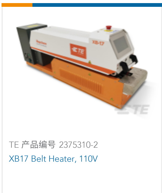
TE 产品编号 2375310-2 XB17 Belt Heater, 110V