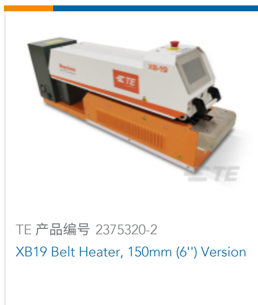
TE 产品编号 2375320-2 XB19 Belt Heater, 150mm (6") Version