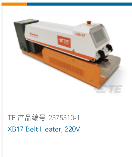
TE 产品编号 2375310-1 XB17 Belt Heater, 220V