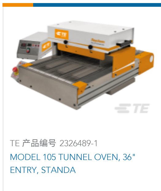
TE 产品编号 2326489-1 MODEL 105 TUNNEL OVEN, 36" ENTRY, STAND