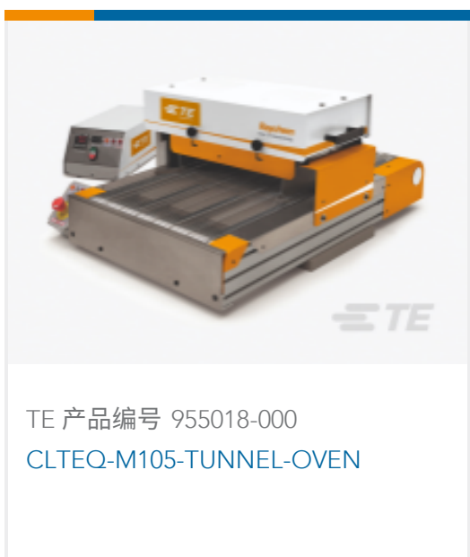
TE 产品编号 955018-000 CLTEQ-M105-TUNNEL-OVEN