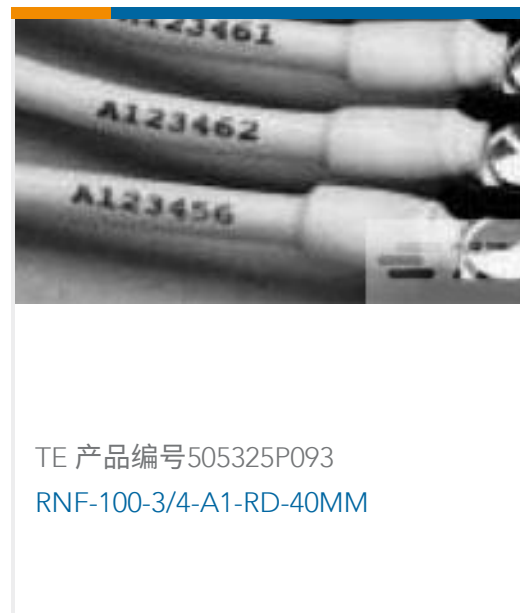
TE 产品编号505325P093 RNF-100-3/4-A1-RD-40MM