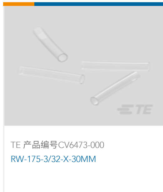
TE 产品编号CV6473-000 RW-175-3/32-X-30MM