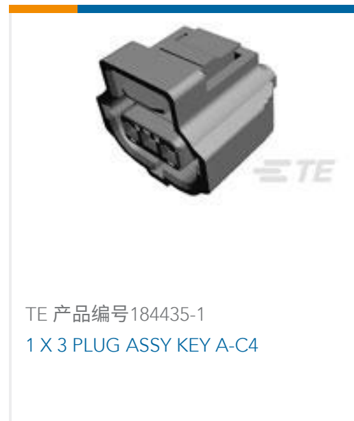
TE 产品编号184435-1 1 X 3 PLUG ASSY KEY A-C4