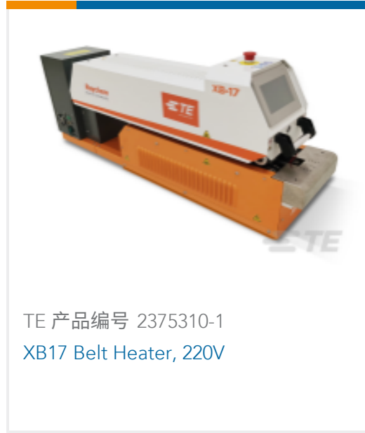
TE 产品编号 2375310-1 XB17 Belt Heater, 220V