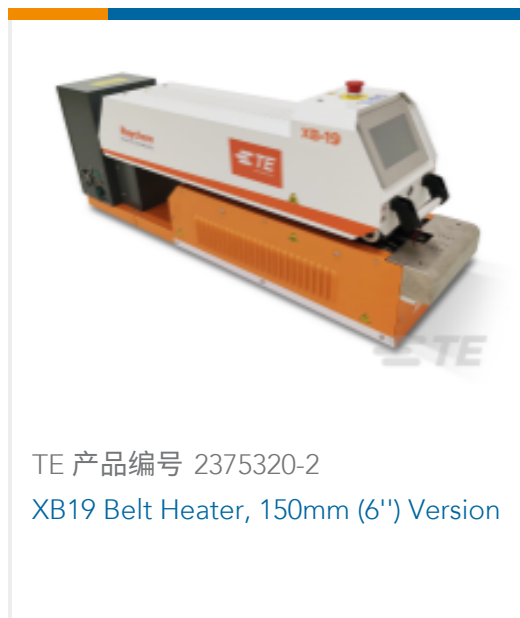
TE 产品编号 2375320-2 XB19 Belt Heater, 150mm (6") Version