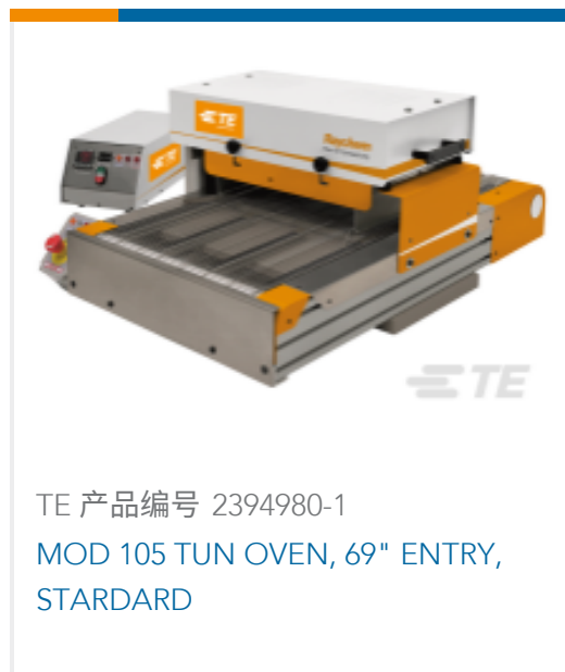
TE 产品编号 2394980-1 MOD 105 TUN OVEN, 69" ENTRY, STANDARD