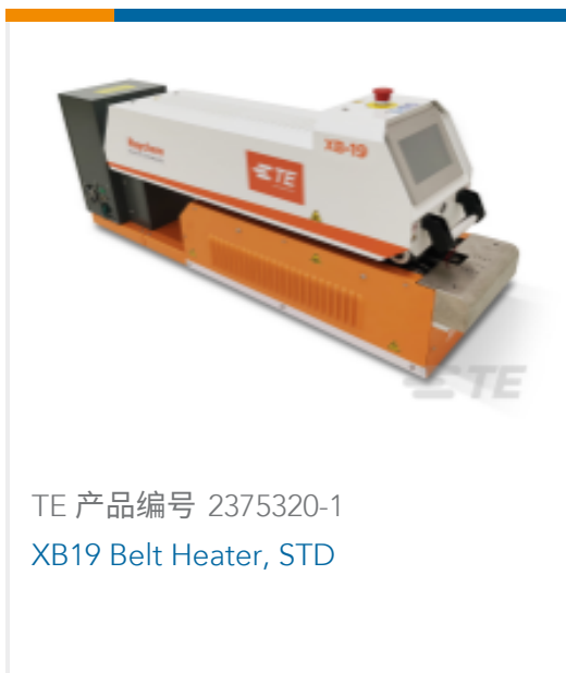
TE 产品编号 2375320-1 XB19 Belt Heater, STD