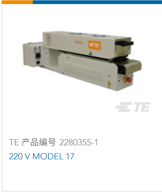
TE 产品编号 2280355-1 220 V MODEL 17