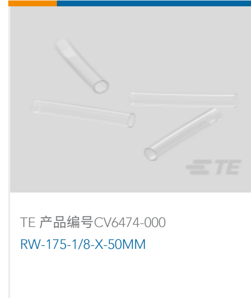
TE 产品编号CV6474-000 RW-175-1/8-X-50MM