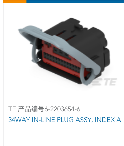
TE 产品编号6-2203654-6 34WAY IN-LINE PLUG ASSY, INDEX A