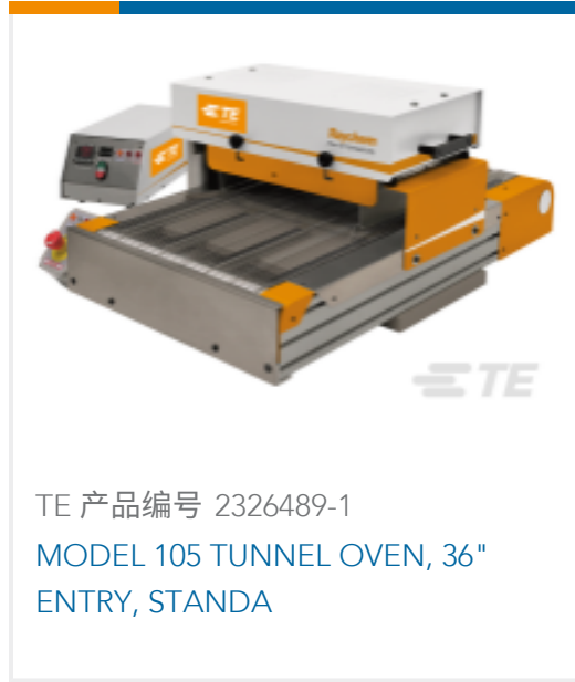
TE 产品编号 2326489-1 MODEL 105 TUNNEL OVEN, 36" ENTRY, STANDA