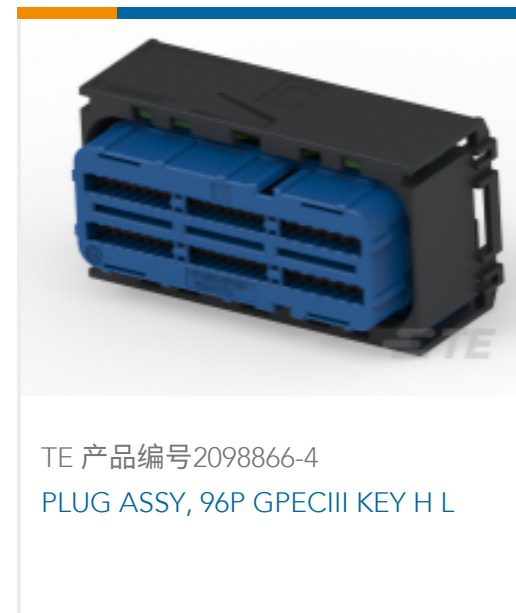
TE 产品编号2098866-4 PLUG ASSY, 96P GPECIII KEY H L