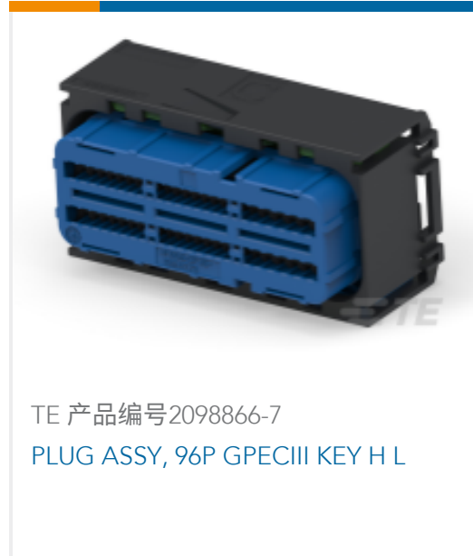
TE 产品编号2098866-7 PLUG ASSY, 96P GPECIII KEY H L