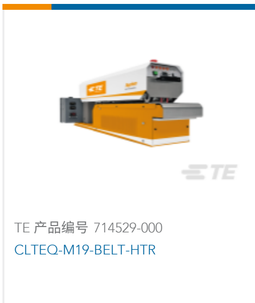
TE 产品编号 714529-000 CLTEQ-M19-BELT-HTR