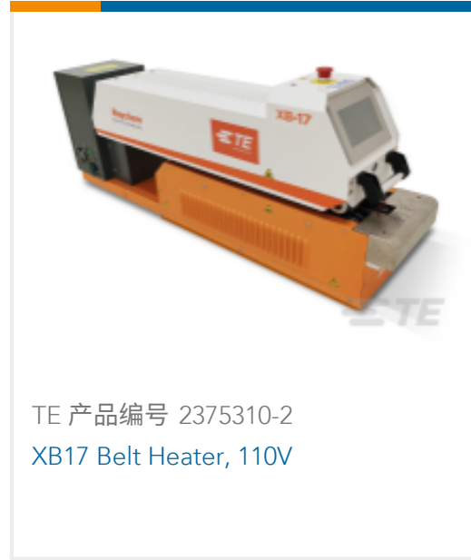
TE 产品编号 2375310-2 XB17 Belt Heater, 110V