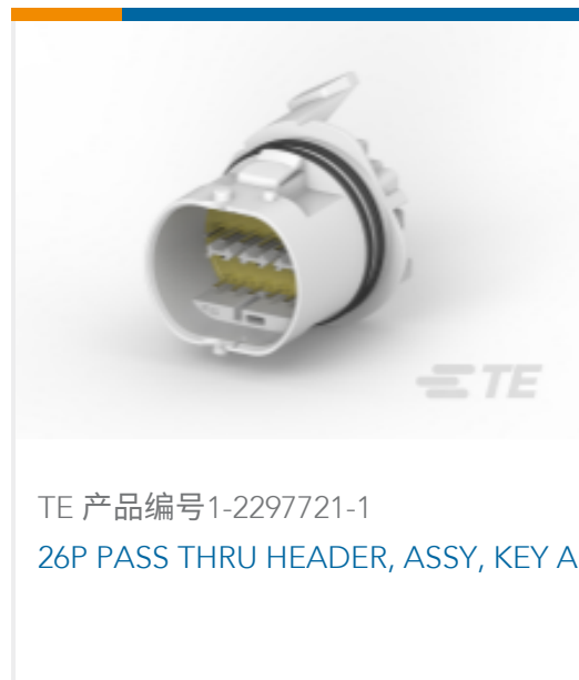
TE 产品编号1-2297721-1 26P PASS THRU HEADER, ASSY, KEY A