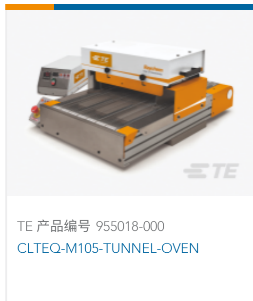
TE 产品编号 955018-000 CLTEQ-M105-TUNNEL-OVEN