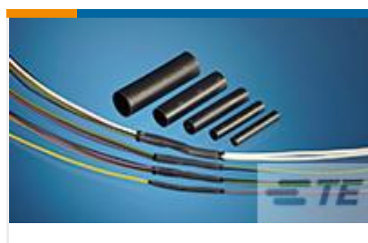
TE 产品编号CV08896001 QSZH-125-NR4-30MM