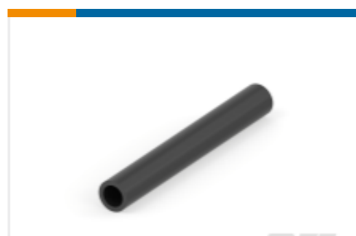
TE 产品编号8208596003 RBK-ILS 热缩管