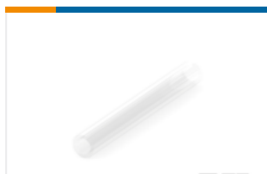
TE 产品编号7121976007 RBK-VWS 热缩管