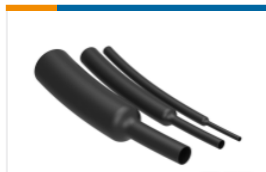
TE 产品编号CV04826001 CGPT 2:1 热缩管