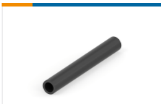
TE 产品编号7501716003 RBK-ILS 热缩管