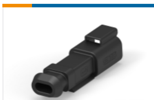
TE 产品编号1-2600022-1 2CCT BLACK RECEPT W/SMALL SEAL & HS