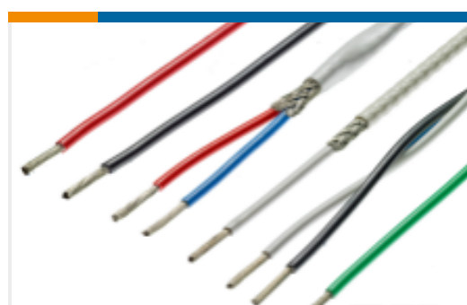
TE 产品编号3821063001 44A0121-24-1/8