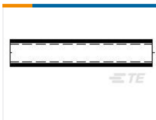
TE 产品编号341263-000 AT099-43