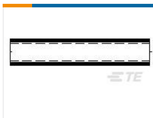
TE 产品编号247265-000 AT099-51