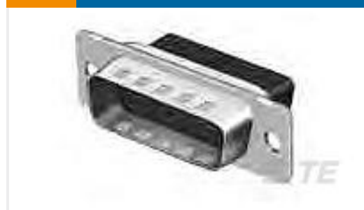
TE 产品编号1658641-3 PLUG ASSY SIZE 5