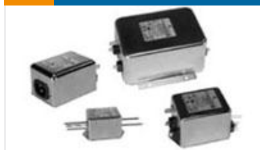
TE 产品编号6609053-5 6EHT1=F7664 S0