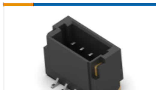
TE 产品编号2367197-4 1.0mm WTB Side Vertical Type With Latch