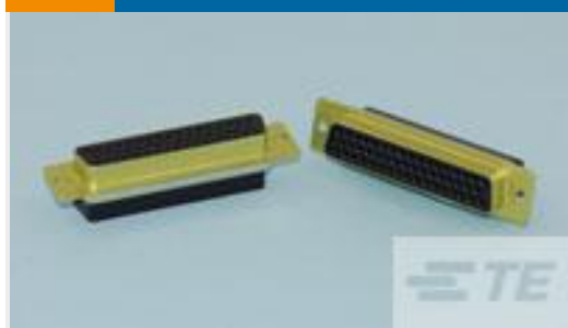
TE 产品编号1658640-2 RECP. ASSEMBLY SIZE 5