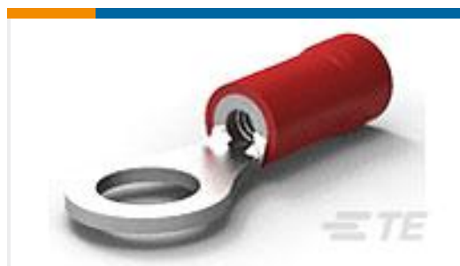
TE 产品编号34149 PG R 22-16 COMM 22-18 MIL 10