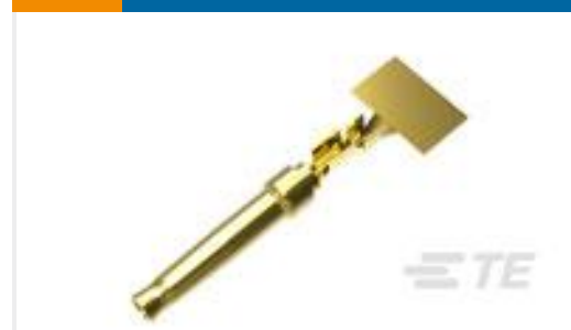
TE 产品编号66505-3 20 DF SCKT CONT