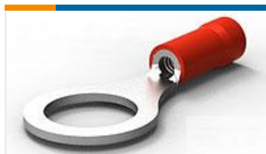
TE 产品编号34151 PG R 22-16 COMM 22-18 MIL 5/16