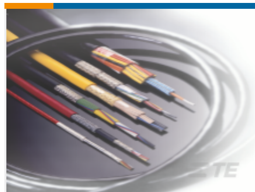
TE 产品编号CQ20563001 100G0111-0.50-9CK0226