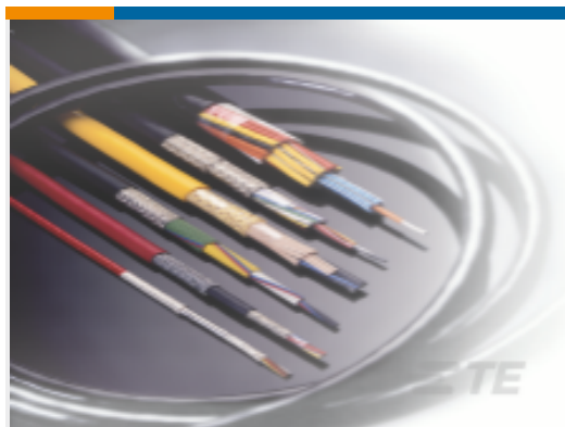
TE 产品编号E661373001 100G0111-1.00-0CK0226