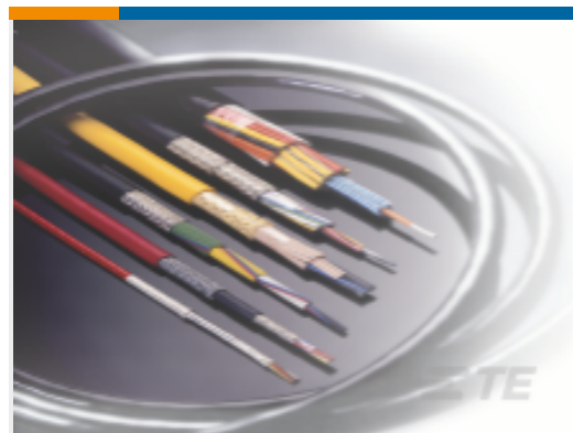
TE 产品编号D541243001 100G0111-2.50-0CK0226