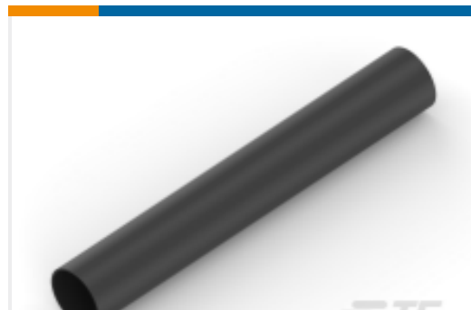
TE 产品编号NB11234001 ATUM-40/13-0-SP