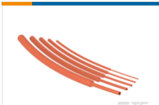
TE 产品编号5053064027 RNF-100-3 热缩管