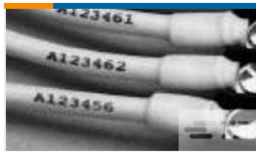
TE 产品编号5053364021 RNF-100-1-1/2-4-SP