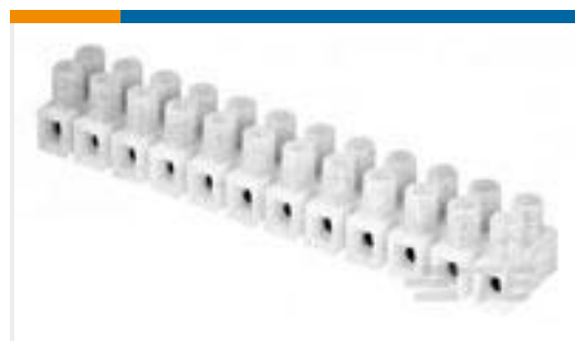
TE 产品编号1776293-6 TSB23006DS=EUROPA TERM BLK, 8MM