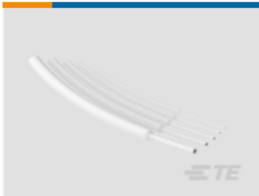
TE 产品编号5053202016 RNF-100-2 热缩管