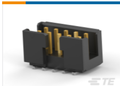
TE 产品编号1-2373376-0 10P,2MM,SHRD HDR,DRVVT,SMD,0.1 AU,TB