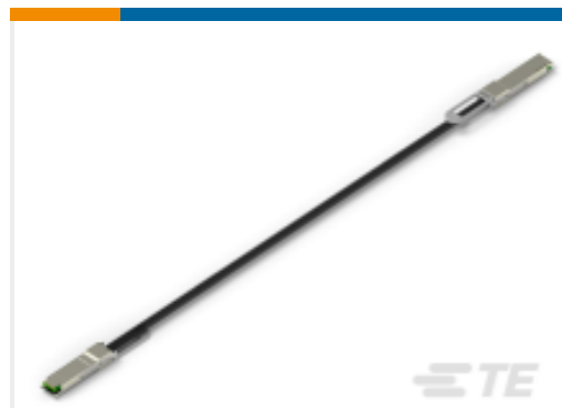
TE 产品编号2333393-7 QSFP 25GIG 30AWG 3 METER