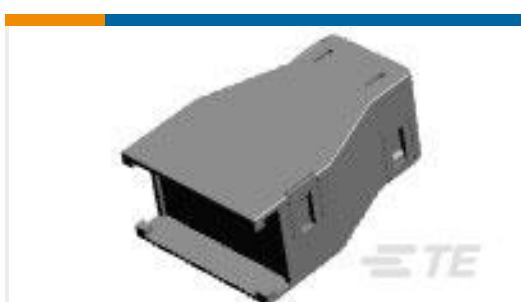
TE 产品编号1986185-1 Strain Relief,6 Posn,D5200 Dynamic. 2