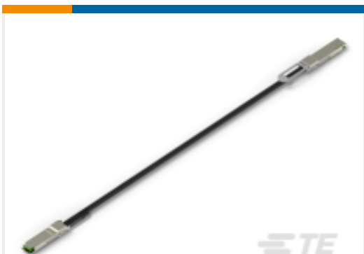
TE 产品编号2333393-7 QSFP 25GIG 30AWG 3 METER