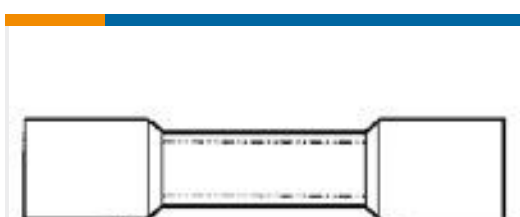
TE 产品编号55845-1 #8 PRE-INSUL SEALED SPLICE