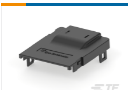
TE 产品编号1986186-1 Strain Relief,20 Posn,D3000 Dynamic, 2