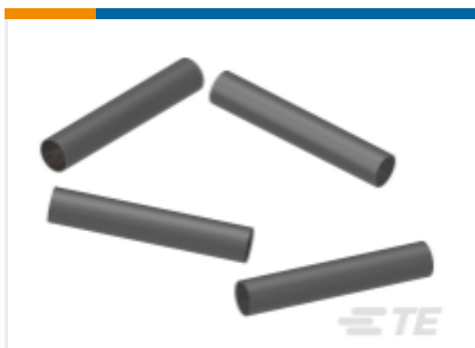
TE 产品编号2534214002 AP-2000 热缩管