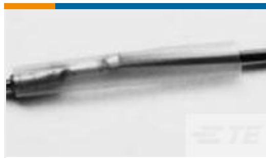
TE 产品编号CV21424001 RW-175-E-1/8-X-SP