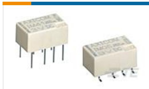
TE 产品编号1462037-1 IM01GR=IM RELAY 140mW 3V