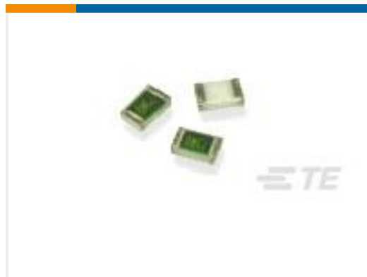
TE 产品编号1676250-1 RN 0805 20K 0.1% 10PPM CUT LENGTH