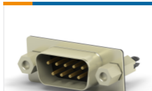
TE 产品编号2301826-2 AMPL PLUG HD20, VERT, 9P, B/L,4-40 S/LOC