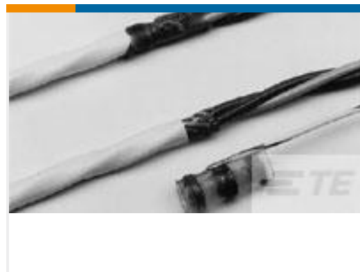
TE 产品编号621065-000 D-142-65