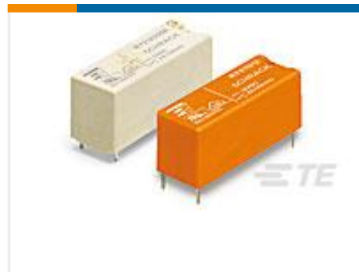
TE 产品编号1-1393225-9 RY611012