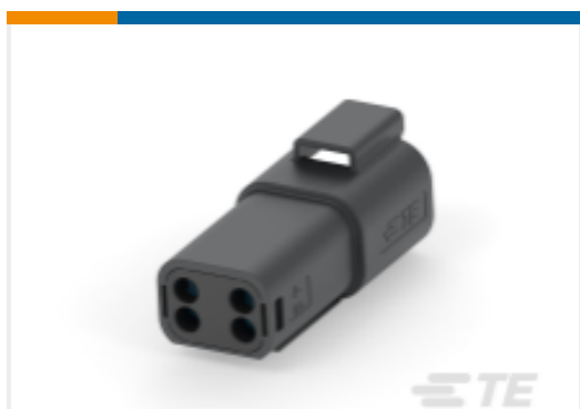
TE 产品编号1-2600030-0 4CCT BLACK RECFP W/LARGE SEAL