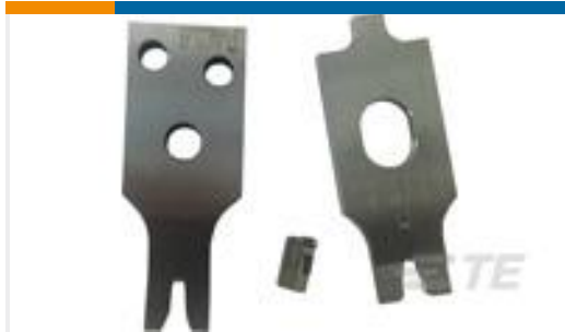
TE 产品编号7-2266270-7 OCEAN_2.0_SPARE_PART_KIT-110F160F