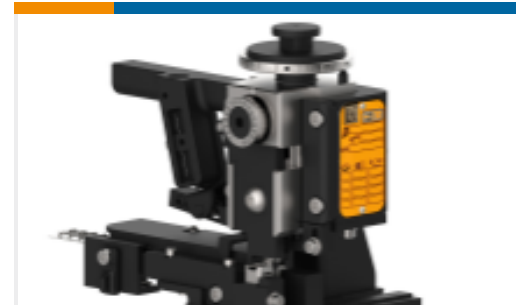
TE 产品编号2266270-1 OCEAN_2.0_Applicator-S-110F160F-RSM