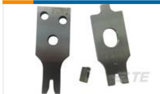
TE 产品编号7-2266273-7 OCEAN_2.0_SPARE_PART_KIT-S-110F190F