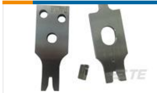
TE 产品编号7-2151110-7 OCEAN_2.0_SPARE_PART_KIT-036F057F