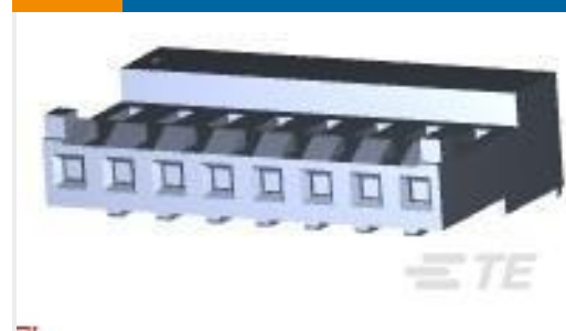
TE 产品编号3-643817-8 08P MTA156 CONN ASSY 18AWG ORA