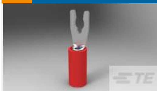
TE 产品编号52927 PIDG SP SPD 22-16COMM22-18MIL4