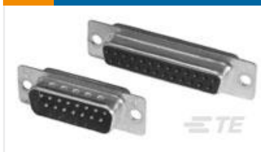
TE 产品编号5-747905-7 9 Rcpt Solder Cup, G/F w/ CN,