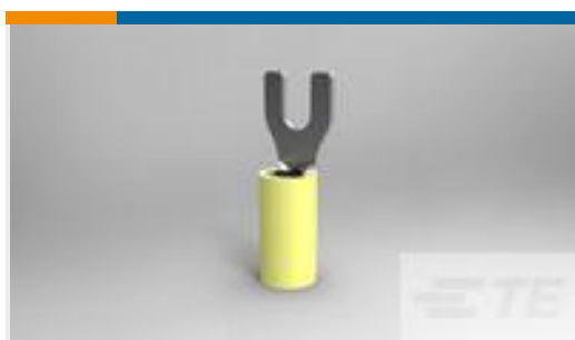
TE 产品编号1377174-4 SMP 0-0130496-0