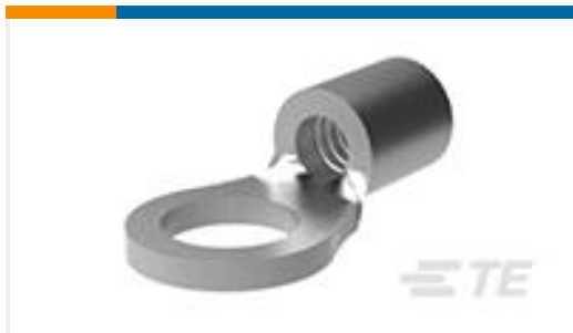
TE 产品编号322454 TERMINAL,SOLIS R 12-10 8