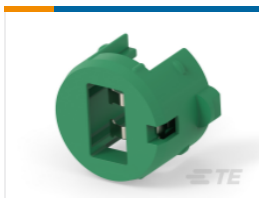
TE 产品编号5-1703884-1 2POS,SHORT CIRC SPR,HOUSING, ASSY