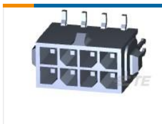
TE 产品编号3-794633-8 08P MICRO MNL ASSY,VRT,SMT,LF