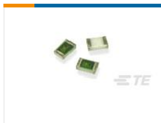
TE 产品编号5-2176093-2 RP 2A 0.25W 33K2 0.1% 25PPM 1K RL