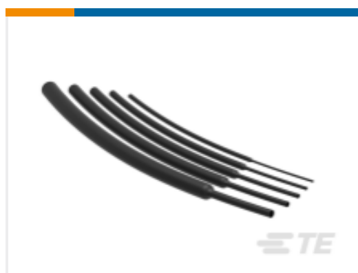
TE 产品编号5053242048 RNF-100-0 热缩管