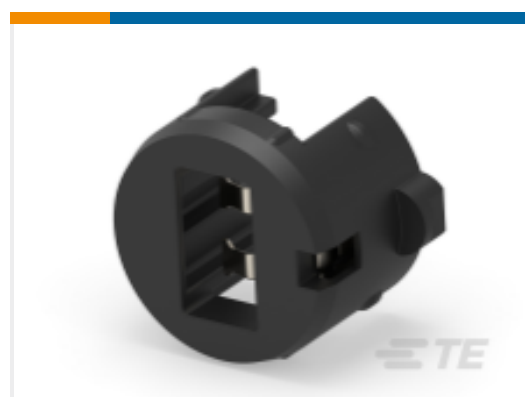
TE 产品编号4-1703884-1 2POS,SHORT CIRC SPR,HOUSING, ASSY