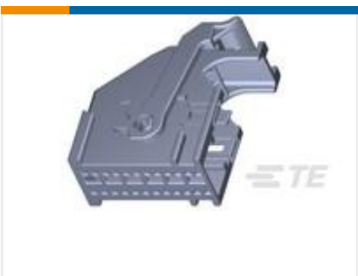
TE 产品编号1703540-2 CONNECTOR,24W AIRBAG FRAME, ASSY,CODA