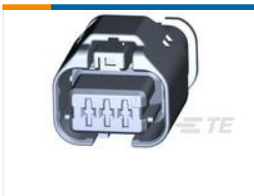
TE 产品编号1801178-4 3W RECEPTACLE HP CONNECTOR YELLOW