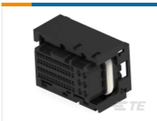
TE 产品编号1-2112778-2 58POS, MIXED,REC HSG,1452415, ASSY,SEALED