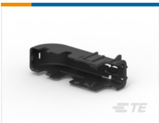
TE 产品编号2112500-2 COVER FOR 38POSN.