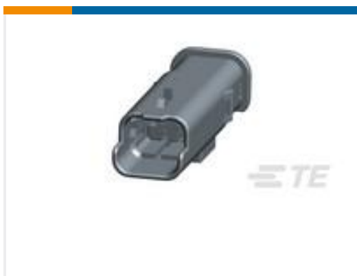
TE 产品编号1801174-3 2W TAB HP CONNECTOR GREY