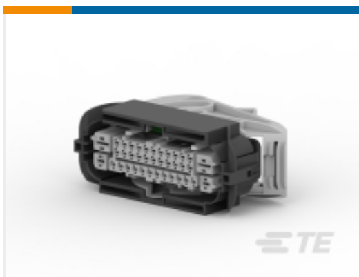
TE 产品编号1-2112499-1 38POS, MIXED,REC HSG,ASSY, SEALED