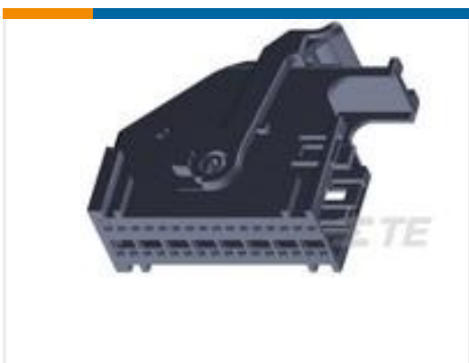
TE 产品编号1563530-1 COVER,0,FOR 32 POS AIRBAG,ASSY, BK