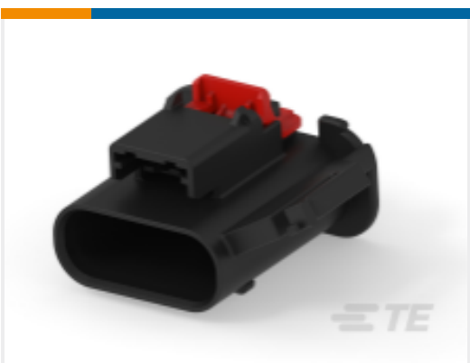
TE 产品编号2383206-1 4POS,1.2X0.6,TAB HSG ASSY,SLD, COD A