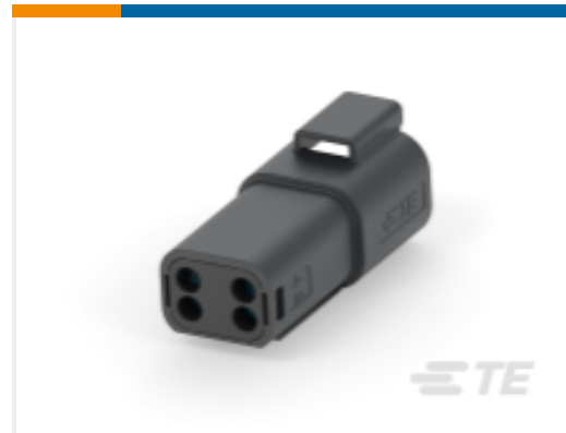
TE 产品编号1-2600030-0 4CCT BLACK RECEP W/LARGE SEAL