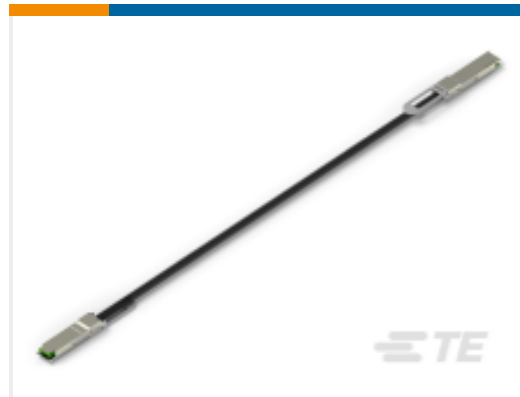
TE 产品编号2333393-7 QSFP 25GIG 30AWG 3 METER