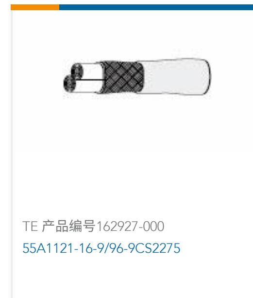
TE 产品编号162927-000 55A1121-16-9/96-9CS2275