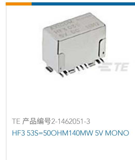
TE 产品编号2-1462051-3 HF3 53S=50OHM140MW 5V MONO