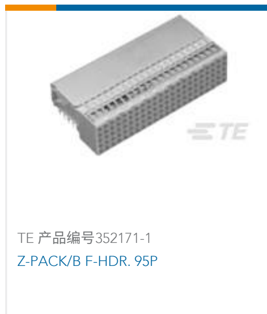
TE 产品编号352171-1 Z-PACK/B F-HDR. 95P