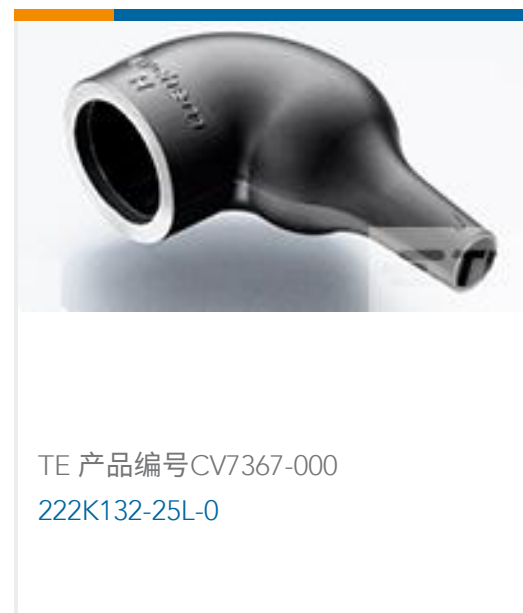
TE 产品编号CV7367-000 222K132-25L-0