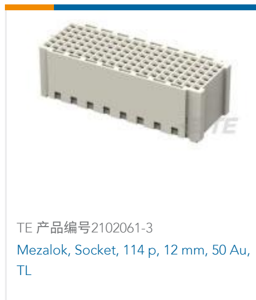
TE 产品编号2102061-3 Mezalok, Socket, 114 p, 12 mm, 50 Au, TL