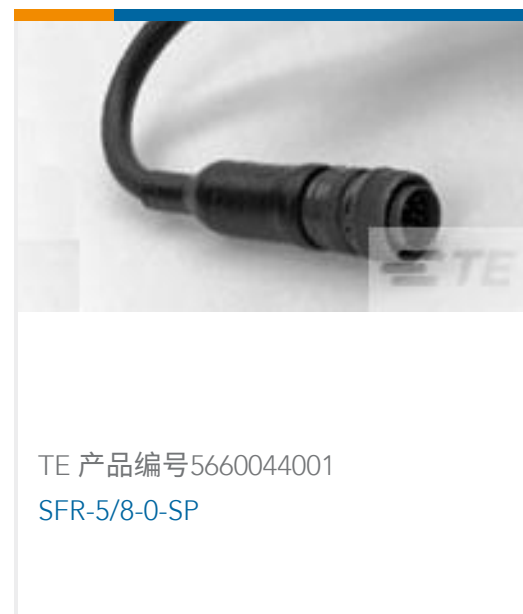
TE 产品编号5660044001 SFR-5/8-0-SP