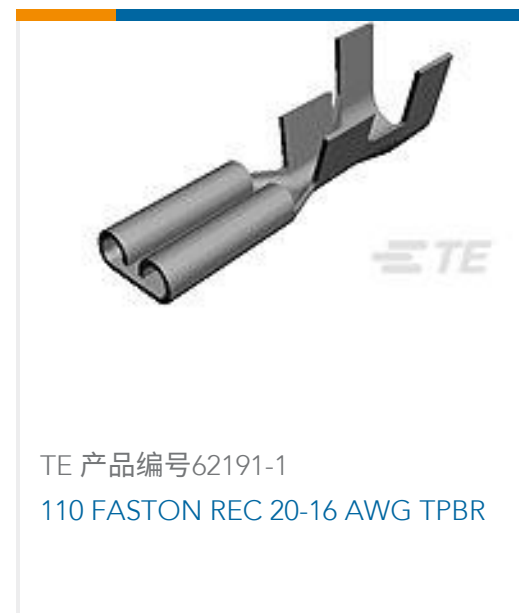
TE 产品编号62191-1 110 FASTON REC 20-16 AWG TPBR