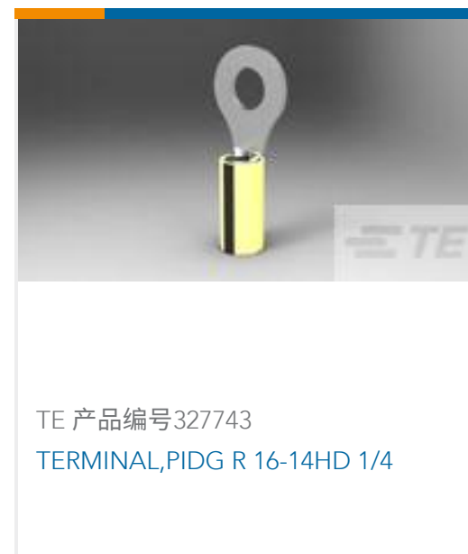
TE 产品编号327743 TERMINAL,PIDG R 16-14HD 1/4