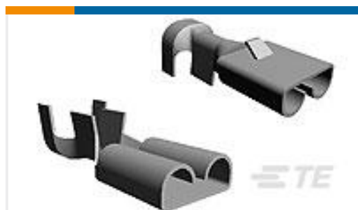
TE 产品编号42100-2 FF 250 REC 18-14AWG TPBR