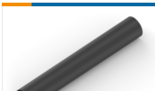
TE 产品编号NB10132001 ATUM-24/6-0-STK