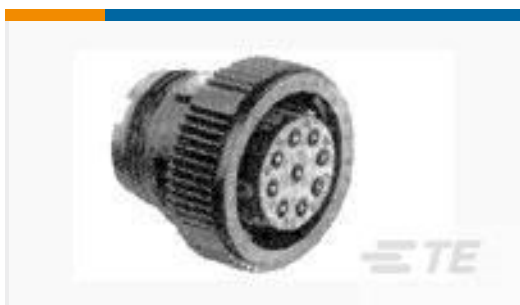
TE 产品编号206485-1 CPC PLUG ASSEMBLY SIZE 11-9