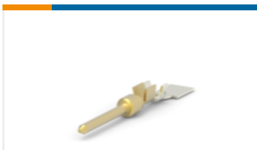
TE 产品编号66682-2 D-Sub 连接器端子：针脚，黄铜，信号，20号